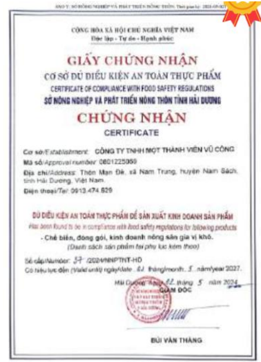
식품 안전 위생 조건 적합 인증서