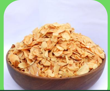
건조 마늘 슬라이스