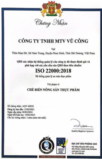
ISO 22000:2018 인증서