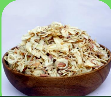
건조 양파 슬라이스