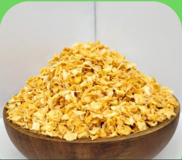
건조 양파 (어린/성숙)