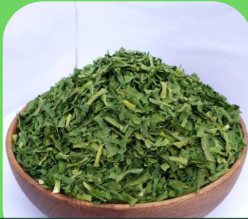
건조 부추 잎