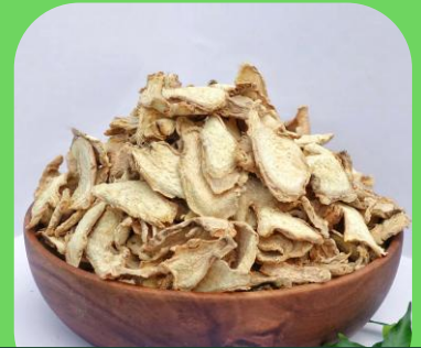
건조 생강 슬라이스