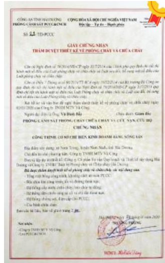
소방 기준 적합 인증서