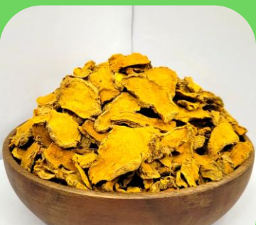
건조 강황 슬라이스