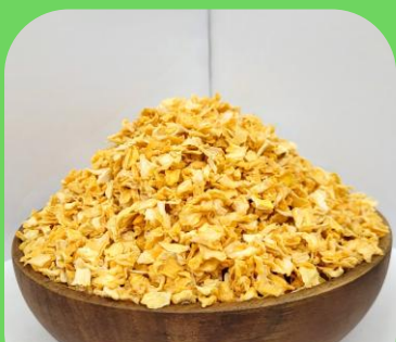
脱水洋葱 (中粒或细粒)