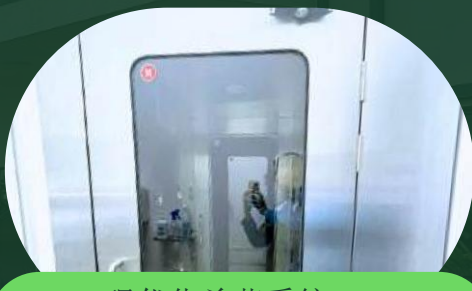
现代化杀菌系统， 确保食品安全卫生