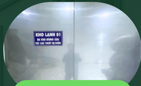
大型冷藏保鲜系统