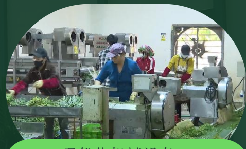
现代化机械设备， 提高生产效率