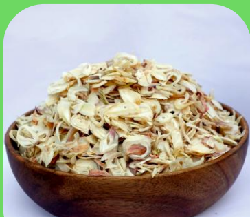
脱水切片越南洋葱