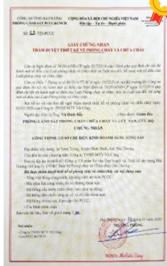
符合消防安全标准的 生产设施认证