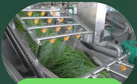
现代化产品清洗工艺