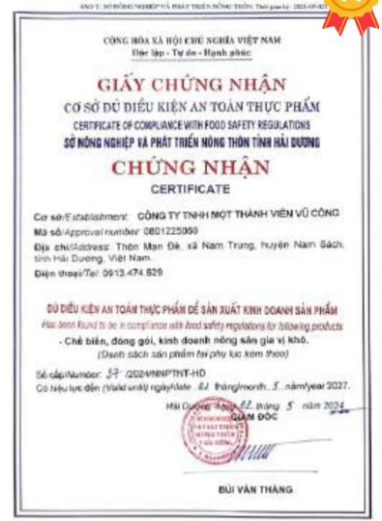
食品安全合规设施认证