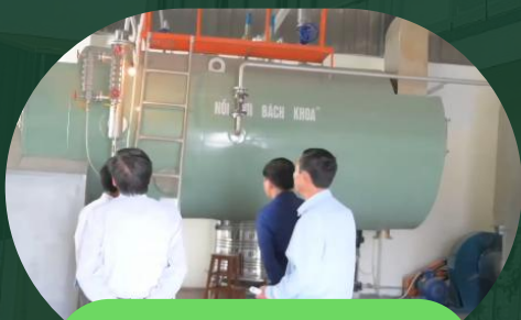
高产能蒸汽烘干系统