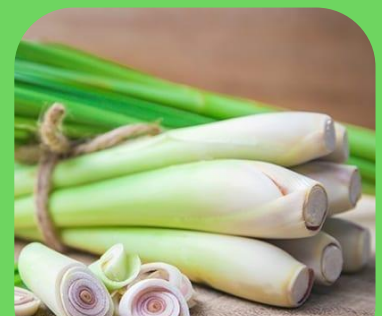
Sả sấy khô