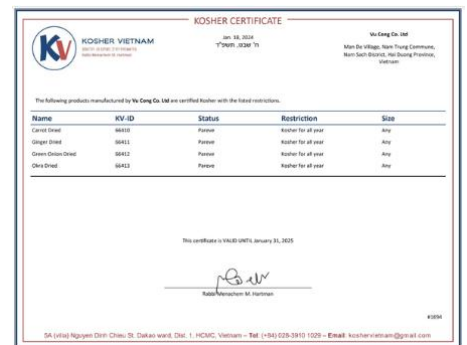
Chứng nhận KOSHER