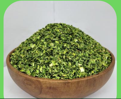
Lá cần tây sấy khô