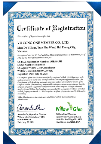
Chứng nhận FDA - Hoa Kỳ