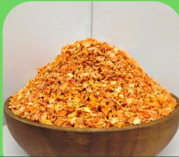
Cà rốt sấy khô