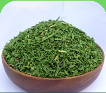
Lá hành sấy khô