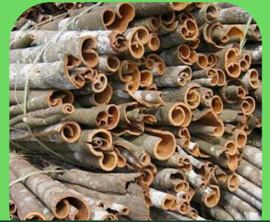
Vỏ quế cây