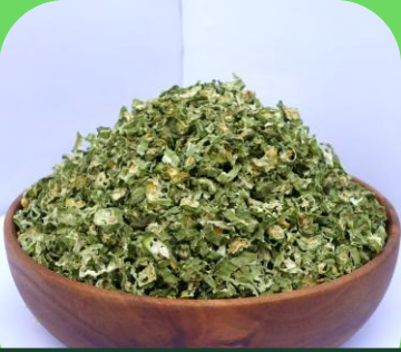
Đậu bắp sấy khô