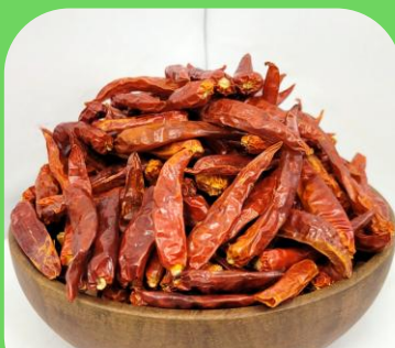
Ớt nguyên trái sấy khô