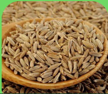
Hạt thì là